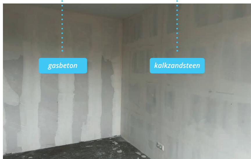
De wand links is een wand van gasbeton en rechts is een wand van kalkzandsteen.