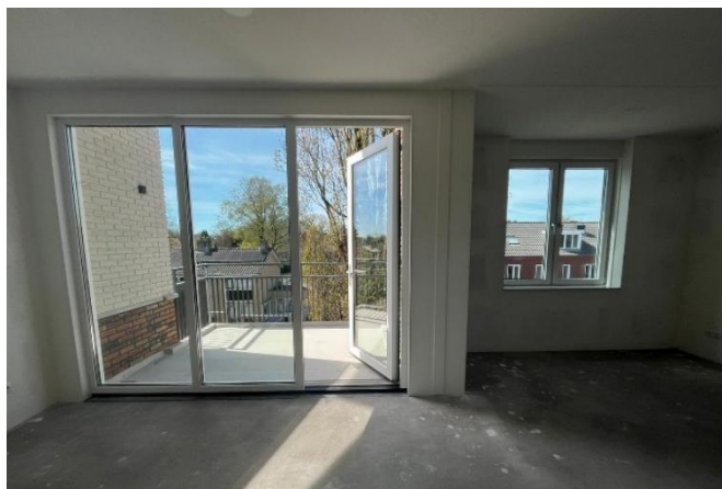
Het uitzicht vanuit een woonkamer op de 3 e verdieping