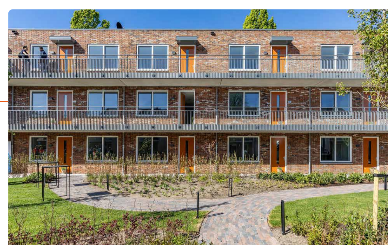
5. Professor Lorentzlaan (nog in ontwikkeling)

nrs. 27 – 49 = 12 woningen nrs. 51 – 81 = 16 woningen