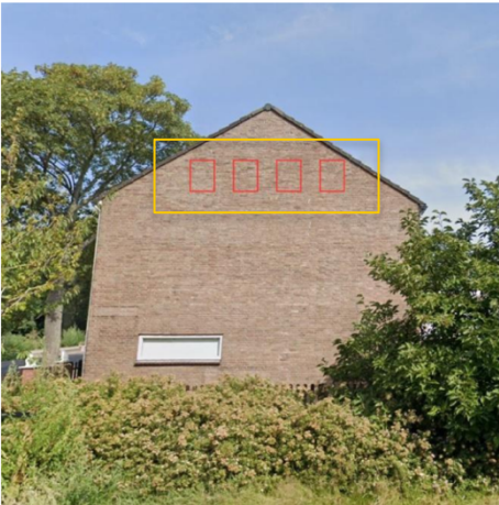
Figuur 2. Plaatsing van ANS1 kasten op kopgevel van eengezinswoning.