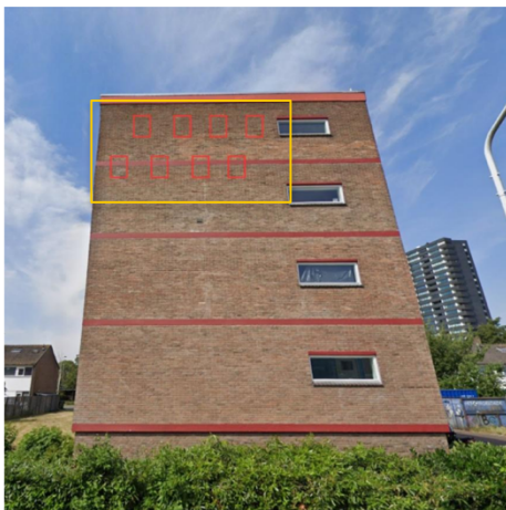
Figuur 4. Plaatsing van ANS1 kasten op de gevel van appartementencomplex in het geval van acht kasten.