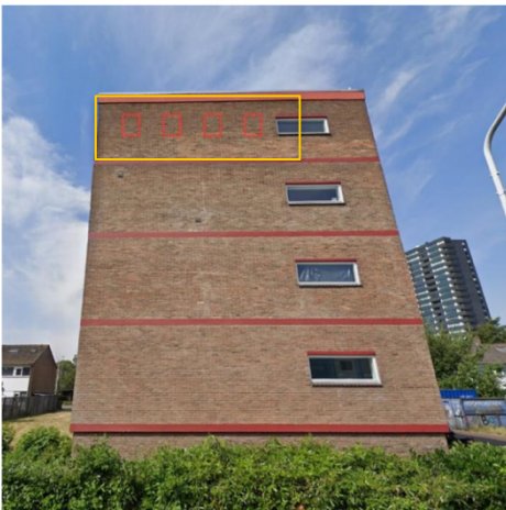
Figuur 3. Plaatsing van ANS1 kasten op de gevel van appartementencomplex in het geval van vier kasten.