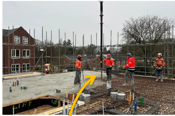
Een kijkje op de tweede verdieping: Hier wordt beton gegoten.