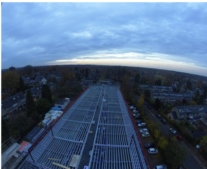
Foto: overzicht van de dakconstructie waarop de nieuwe appartementen worden geplaatst.

In de week van 17 november begint de aannemer met de montage van de wanden en daken. Deze werkzaamheden zullen doorlopen tot eind december. Van half december tot maart gaat de aannemer zich richten op de buitenafwerking, waaronder de gevel- en balkonafwerking. Tussen januari en eind maart werkt de aannemer aan de binnenzijde van de appartementen.