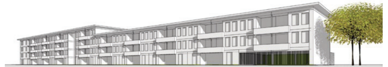
Deze afbeelding is een voorbeeld hoe de nieuwbouw er uit zou kunnen zien. Er kunnen geen rechten aan ontleend worden.

Portaal bouwt 60 tot 80 BENG-woningen (Bijna Energie Neutraal Gebouw) terug over meerdere bouwlagen. Er komen 2- en 3-kamerwoningen van 50m 2 tot 70m 2 die bereikbaar zijn via een galerij. Bij de 3-kamerwoningen onderzoeken we de mogelijkheid om door het plaatsen van een wand een 4-kamerwoning te realiseren. Het complex wordt voorzien van een lift, zodat de woningen voor iedereen bereikbaar zijn. Parkeren kan straks op het terrein of in de buurt.